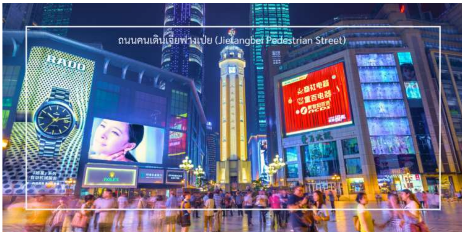
ถนนคนเดินเจี๋ยฟางเป่ย์ (Jiefangbei Pedestrian Street)

สมควรแก่เวลา นำท่านสู่ ถนนคนเดินเจี๋ยฟางเป่ย์ (Jiefangbei Pedestrian Street) เป็นหนึ่งในแหล่งช้อปปิ้งและท่องเที่ยวที่สำคัญที่สุดในเมืองฉงชิ่ง (Chongqing) เป็นพื้นที่ที่มีชีวิตชีวาและคึกคัก มีร้านค้า ร้านอาหาร และสถานบันเทิงมากมาย ถนนนี้ตั้งอยู่ใกล้กับสถานที่ท่องเที่ยวสำคัญอื่นๆ เช่น มหาศาลาประชาชนแห่งเมืองฉงชิ่ง ทำให้สามารถเดินเที่ยวชมได้อย่างสะดวก ถนนสายนี้มีบรรยากาศที่มีชีวิตชีวา โดยเฉพาะในช่วงเย็นที่มีแสงไฟและการแสดงต่างๆ ที่ทำให้บรรยากาศน่าสนใจยิ่งขึ้น และยังเต็มไปด้วยร้านค้าแบรนด์เนม ร้านค้าท้องถิ่น และตลาดที่ขายสินค้าต่างๆ เช่น เสื้อผ้า เครื่องประดับ และของที่ระลึก ท่านสามารถ แวะซื้อร้านดัง “POPMART” ร้านดังจากจีน ที่รวมพิกเกอร์ดีไซน์เก๋และตุ๊กตาน่ารักหลากหลายซีรีส์ยอดนิยม เช่น Molly, Dimoo, Labubu และอีกมากมาย ที่สายสะสมของเล่นไม่ควรพลาด