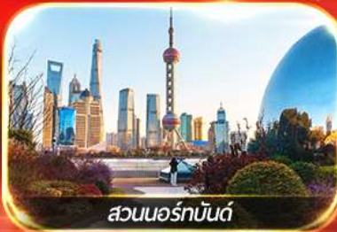
สวนนอร์มัลด์