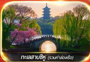
ทะเลสาบซีหู (รวมค่าล่องเรือ)