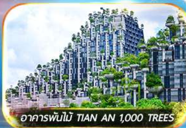
อาคารพื้ไม้ TIAN AN 1,000 TREES