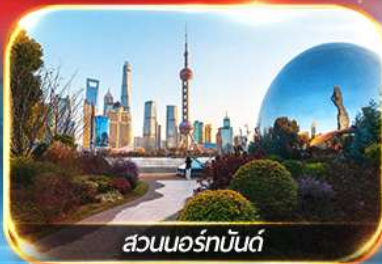
สวนนอร์มัลด์