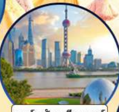
นอร์ทบัน กรีนแลนด์