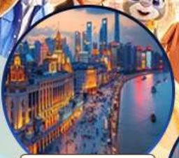
หาดไวทาน

สนุกจุใจ เซี่ยงไฮ้ ดิสนีย์แลนด์ ฟรีเดย์ 1 วัน