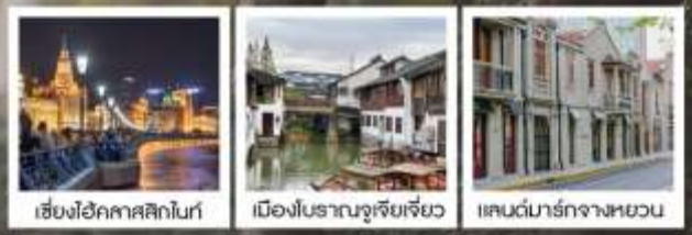
เซี่ยงไฮ้คทาสสิกไนท์ / เมืองโบราณจูเจียเจียว / แคนด์มาร์กจางหยวน

เซี่ยงไฮ้ คทาสสิก ไนท์ / 3 ดึกใหญ่แห่งเซี่ยงไฮ้ คองเรือหมู่บ้านโบราณจูเจียเจียว / EKA Tianwu / วัดหลงหัว แลนด์มาร์ก จางหยวน / ถนนหวยไห่ / ชมโชว์ ERA ที่โรงละครโด่งดังระดับโลก / ซินเทียนตี้