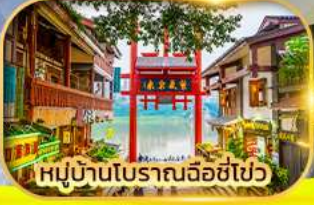
หมู่บ้านโบราณฉือซีไซ่ว