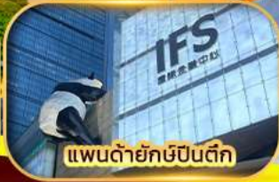
แพนด้ายักษ์ป็นตึก