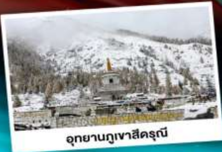
อุทยานกุเวาสีครุณี