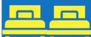
ห้องพักเตียงคู่ TWIN