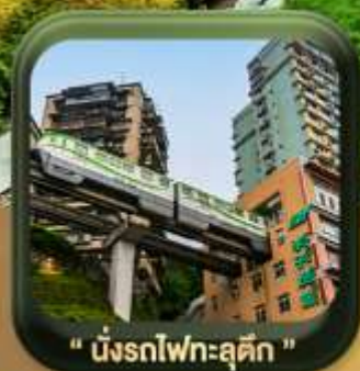
" นังรถไฟทะลุคิก "

บินตรงลงหลงชิ่ง • อุ่หลง หลุมฟ้าสะพานสวรรค์ • ระเบียบแก้ว • อุทยานเขานางฟ้า หงหยาดัง • นังรถไฟทะลุคิก • ศาลาประชาม (ด้านนอก) • หลงหมินฮ่าว มรดกโลกผาหินแกะสลักต้าจู้ • วัดหลิวอัน • ตึกตะเกียบ • ถนนคนเดินเจียฟางเป็ย