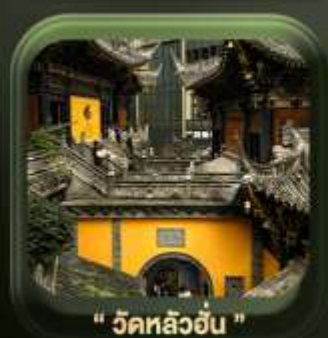
" วัดหลิวอัน "