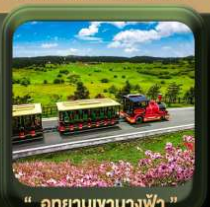
" อุทยานเขานางฟ้า "

T2G-CKG26CZ Special of Chongqing...หลงชิ่ง ต้าจู้ อุ่หลง อุทยานหลุมฟ้า เขานางฟ้า 5D 3N (CZ)