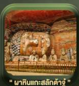
" ผาหินแกะสลักต้าจู้ "