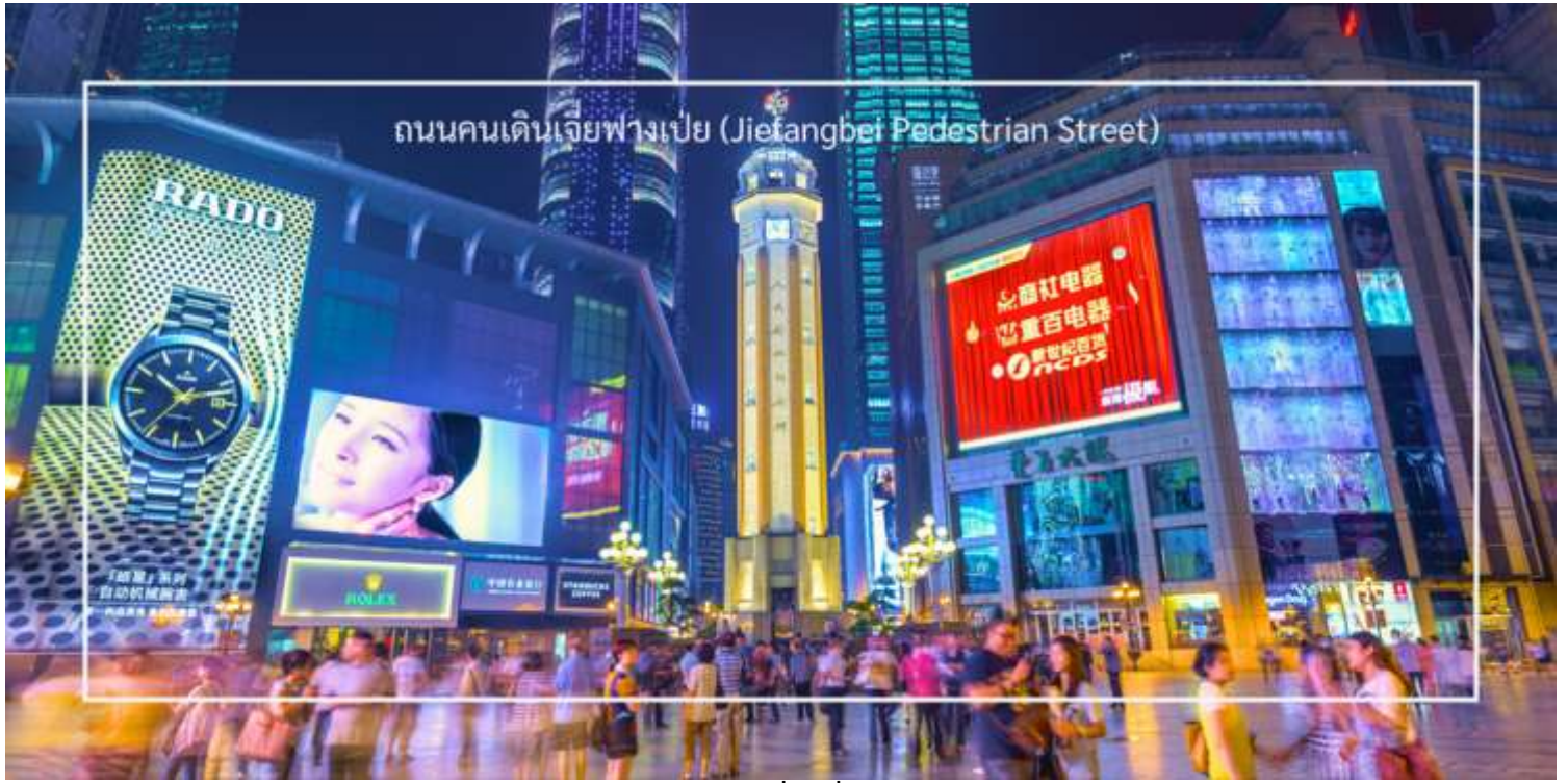
ถนนคนเดินเจียงฟางเป่ย์ (Jiefangbei Pedestrian Street)

ได้เวลาอันสมควร นำท่านเดินทางสู่สนามบินฉงชิ่ง เพื่อเดินทางกลับ