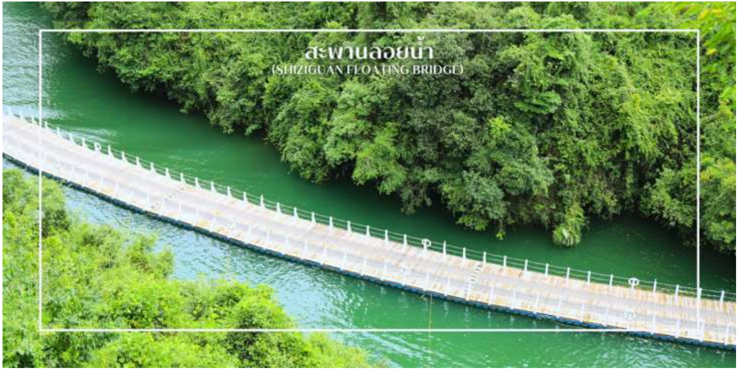
สะพานลอยน้ำ (SHIZIGUAN FLOATING BRIDGE)

สมควรแก่เวลานำท่านสู่ ถนนคนเดินเินซือ (Enshi Daughter City Pedestrian Street) หรือเรียกอีกชื่อ ถนนคนเดินเมืองลูกสาวเินซือ เป็นศูนย์กลางกิจกรรมท้องถิ่นที่เต็มไปด้วยสีสันและวัฒนธรรมของเินซือ ถนนเส้นนี้เต็มไปด้วยร้านค้า ร้านอาหาร และแผงขายสินค้าพื้นเมือง ทั้งของฝาก งานหัตถกรรม และอาหารท้องถิ่น ทำให้นักท่องเที่ยวได้สัมผัสวิถีชีวิตของคนท้องถิ่นอย่างใกล้ชิด บรรยากาศในยามค่ำคืนมีชีวิตชีวา แสงไฟประดับถนนสวยงามตัดกับภูมิทัศน์เมืองเก่า และมีมุมถ่ายภาพสวยๆ ให้ผู้มาเยือนได้เก็บความประทับใจ