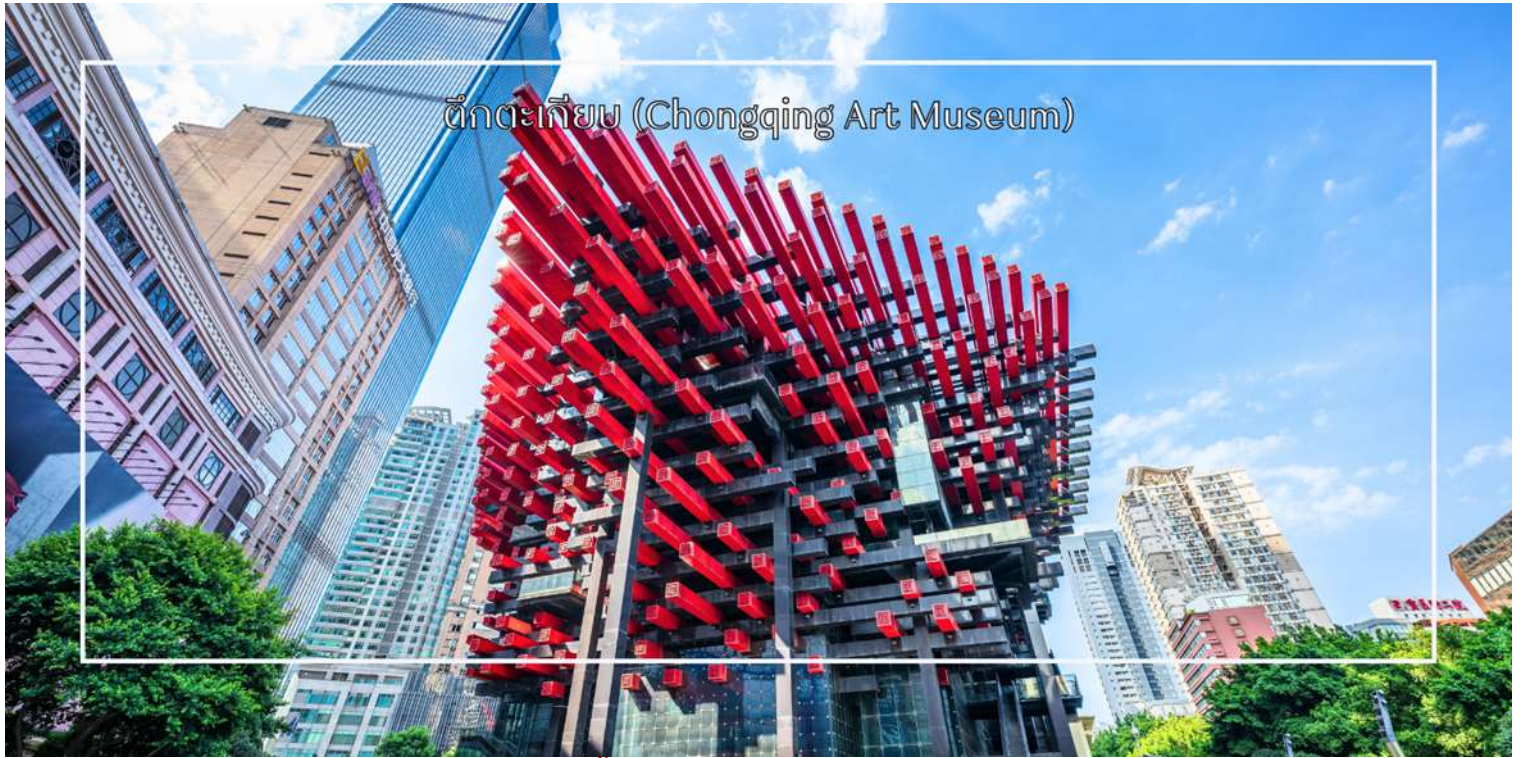
ตึกตะเกียบ (Chongqing Art Museum)

จากนั้นนำท่านชม ตึกไควชิงโหล (Kuaiqinglou) 22 ชั้น ตึกสุดแปลกเดินจากชั้น 1 กลายเป็นชั้นที่ 22 แลนด์มาร์กสำคัญที่ตั้งตระหง่านอยู่ใจกลางเมืองฉงชิ่ง โดดเด่นด้วยสถาปัตยกรรมสูงส่งที่ผสมผสานความทันสมัยเข้ากับเสน่ห์ของวัฒนธรรมท้องถิ่นอย่างลงตัว จากชั้นบนสุดของตึกสูง 22 ชั้นแห่งนี้ ท่านจะได้ชมทัศนียภาพแบบพาโนรามา 360 องศา ทั้งแม่น้ำแยงซีที่ทอดยาวคดโค้งและภาพเมืองฉงชิ่ง จากนั้นแวะถ่ายรูปและสัมผัสความสวยงามของ ตึกตะเกียบ (Chongqing Art Museum) แลนด์มาร์กสุดแปลกตาใจกลางเมือง ที่ออกแบบอาคารให้มีลักษณะคล้ายตะเกียบ ยักษ์สีแดง-ดำซ้อนกันอย่างโดดเด่น อาคารแห่งนี้เป็นทั้งศูนย์จัดแสดงศิลปะร่วมสมัยและจุดถ่ายภาพยอดนิยมของนักท่องเที่ยว ด้วยดีไซน์ทันสมัยและเอกลักษณ์เฉพาะตัว ทำให้ที่นี่กลายเป็นหนึ่งในสถานที่ที่ต้องมาเยือน