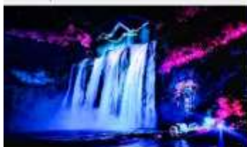
อุทยานน้ำตกหวงทิวชู่