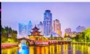
หอเจียเซียวไหลว