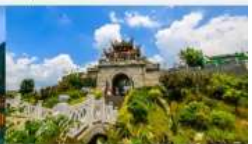
เมืองโบราณซิงเหยียน

*ทางบริษัทฯ ขอสงวนสิทธิ์ในการสลับโปรแกรมทัวร์ตามความเหมาะสมขึ้นอยู่กับสถานการณ์หน้างาน โดยคำนึงถึงผลประโยชน์ของลูกค้าเป็นสำคัญ