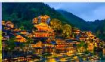
หมู่บ้านโบราณวูเจียงจ้าย