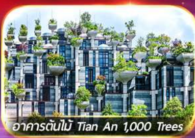
อาคารต้นไม้ Tian An 1,000 Trees