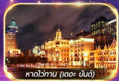
หาดไว่ทาน (เดอะ บันด์)

เที่ยวดิสนีย์แลนด์เต็มวัน (รวมรถรับ-ส่ง)