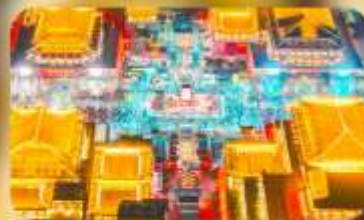
ถนนวัฒนธรรมต้าถิง