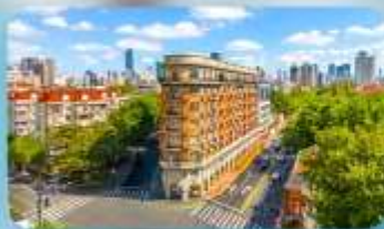
ถนนอันฟู