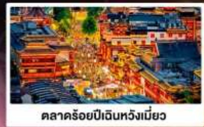
ตลาดร้อยปีเงินหวงเมี่ยว