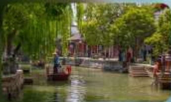
เมืองโบราณจูเจียเจีว

HOLIDAY INN EXPRESS HOTEL หรือเทียบเท่า 4 ดาว