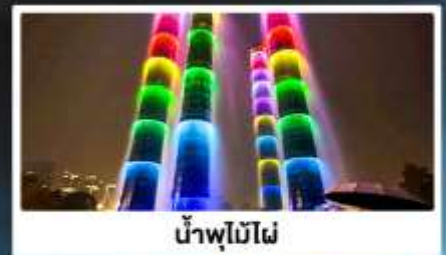
น้ำพุไม้ไฟ