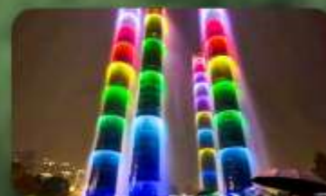
น้ำพุไม้ไฟ