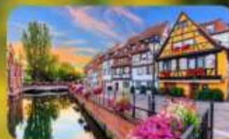
ดินแดนแห่งเทพนิยาย กอลมาร์