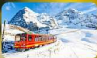
พิกัดยอดเขาจุงเฟรา

พักที่ Pullman Paris Tour Eiffel Hotel Rate !!! คือ: ดินแดนเก่า หรือ: ดินแดนเก่า