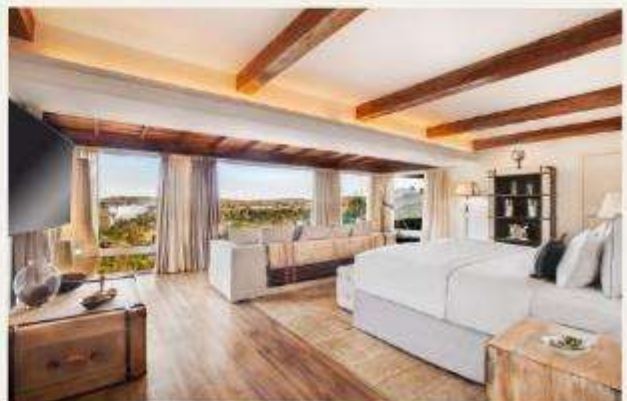
Hotel das Cataratas, A Belmond Hotel