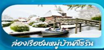
ล่องเรือชมหมู่บ้านทอร์น

เดินทาง 29 ม.ค. - 05 ก.พ. 69 25 ก.พ. - 04 มี.ค. 69 / 28 พ.ค. - 04 มิ.ย. 69