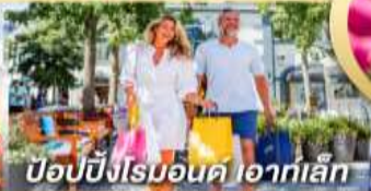
ป๊อปป์ปิงโรมอนด์ ไอวก์เล็ก