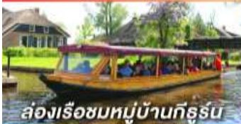
ล่องเรือชมหมู่บ้านกังหัน