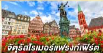
จัตุรัสโรเมอร์แฟรงก์เฟิร์ต