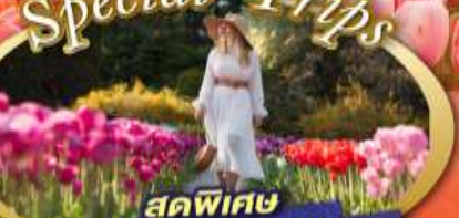
สุดพิเศษ กับสวนดอกทิวลิป ที่จัดเพียงปีละหนึ่งครั้ง