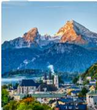
ออสเตรียบาวาเรียดินแดนแห่งเทพนิยาย