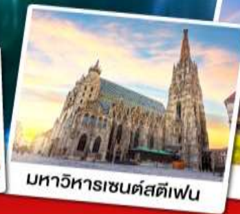
มหาวิหารเซนต์สตีเฟ่น