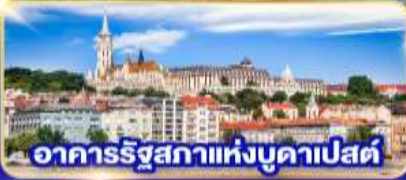
อาคารรัฐสภาแห่งบูดาเปสต์