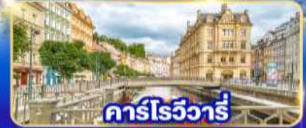
คาร์โรวัวร์