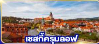
เซสท์ครุมลอฟ