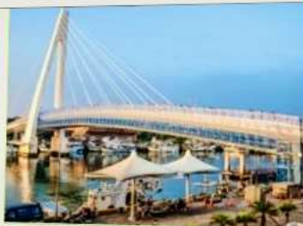
สะพานคู่รักตั้นสุ่ย